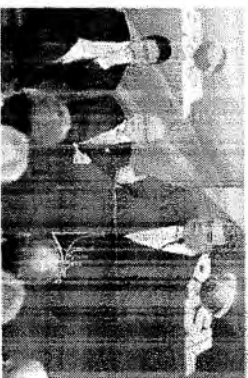
Ministro do Meio Ambiente, José Sarney Filho

A plôs o presidente Michel Temer ter vetado as medidas prioritárias que reduzem áreas de floresta, propostas da Amazônia, o governo apresentou um projeto de lei com a intenção de reduzir o texto, que já está em análise pelo Congresso. O projeto prevê a redução de áreas de floresta em até 10% em áreas de floresta já protegidas.