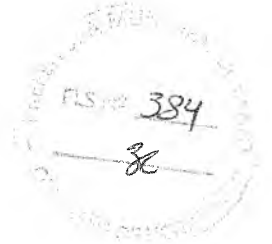
Antonia Otonite de Oliveira Cortez Secretária de Educação