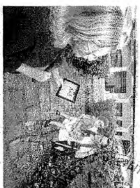
Sistema ainda indica para a escola quem pode buscar a criança

PERGUNTA MUNICIPAL DE SANTARÉM - RR - sobre o licenciamento ambiental de uma obra de construção civil em uma área de preservação ambiental.