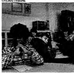
A FAMÍLIA entrou na Justiça após Linda ser obrigada a frequentar escola para negros

O ministro do Supremo Tribunal Federal (STF) Edson Fachin, relator da Operação Lava Jato na Corte, afirmou ontem que a família dele está recebendo ameaças e que já pediu providências à presidente do STF, Cíceron Lúcia. Em resposta, a Secretaria de Comunicação Social do Supremo informou, ainda na noite de ontem, que autorizou o aumento do número de agentes para escolta permanente do ministro e reforçou uma pedido para que a diretoria geral do órgão examine outras providências para aumento do número de agentes de segurança para a família do ministro em Curitiba, conforme por ele solicitado.