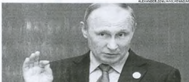
O presidente da Rússia, Vladimir Putin, assegurou ontem que a Rússia não tem nada a ver com o ciberataque global

“A Rússia não tem absolutamente nada a ver com o vírus informático” que originou o ataque que infectou dezenas de milhares de computadores da Rússia à Espanha, ou do México à Austrália, passando pela China, afirmou Putin em uma coletiva de imprensa em Pequim. Os Estados Unidos acusaram várias vezes a Rússia de ingerência na recente eleição presidencial americana, e alegaram que hackers russos invadiram os e-mails da candidata democrata Hillary Clinton. Estas acusações foram firmemente desmentidas por Moscou. “Sempre se busca culpados onde eles não estão”, afirmou Putin, lembrando inclusive que, segundo a Microsoft, “os serviços especiais americanos eram a primeira fonte deste vírus”.