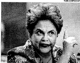
Ex-presidente nega que tenha discutido sobre pagamentos