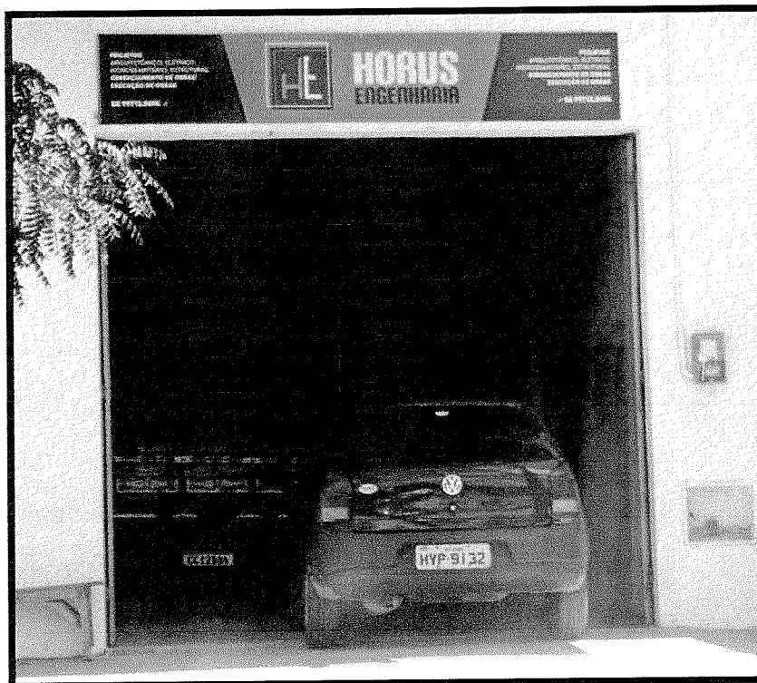
FACHADA DA EMPRESA BENEDITO JOSÉ GONÇALVES BISNETO ME (HORUS ENGENHARIA)

No dia 17 de março do corrente ano foi realizada uma visita à sede da empresa BENEDITO JOSÉ GONÇALVES BISNETO ME (HORUS ENGENHARIA), localizada à Rodovia BR 230, N° 289, bairro Centro, no município de Lavras da Mangabeira e, chegando ao endereço indicado, constatou-se que a empresa se encontra em pleno funcionamento. Em sua fachada a empresa conta com um letreiro de identificação, como consta na imagem a seguir.