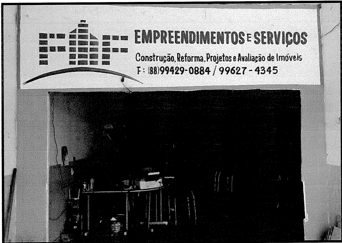
FACHADA DA EMPRESA FF EMPREENDIMENTOS E SERVIÇOS LTDA

No dia 17 de março do corrente ano foi realizada uma visita à sede da empresa FF EMPREENDIMENTOS E SERVIÇOS LTDA, localizada à Rua Dr. Aluizio Teixeira Ferrer, Nº 332, Centro, no município de Lavras da Mangabeira e, chegando ao endereço indicado, constatou-se que a empresa se encontra em pleno funcionamento. Em sua fachada a empresa conta com um letreiro de identificação, como consta na imagem a seguir.