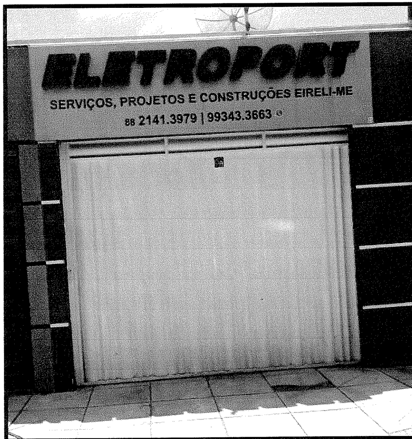
FACHADA DA EMPRESA ELETROPORT SERVIÇOS PROJETOS E CONSTRUÇÕES EIRELI ME

No dia 17 de março do corrente ano foi realizada uma visita à sede da empresa ELETROPORT SERVIÇOS PROJETOS E CONSTRUÇÕES EIRELI ME, localizada à Rua Raimundo Gonçalves de Santana, Nº 186, Lagoa Seca, no município de Juazeiro do Norte e, chegando ao endereço indicado, constatou-se que a empresa se encontra em pleno funcionamento. Em sua fachada a empresa conta com um letreiro de identificação, como consta na imagem a seguir.