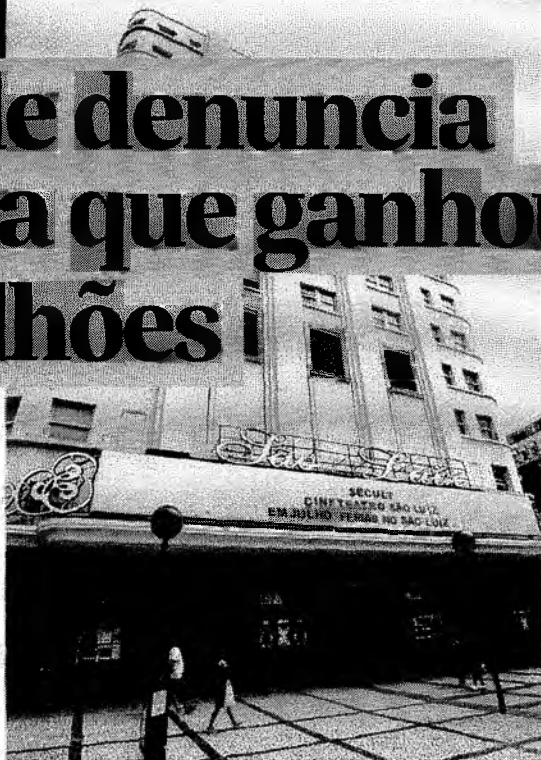
NO CENTRO DE FORTALEZA, a sede da Secult, para onde convergem denúncias e protestos

HENRIQUE ARAÚJO henriquearaujo@povo.com.br