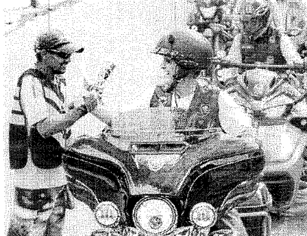
PASSEIO solo do Cid e se encerrou pelas ruas de Messejana