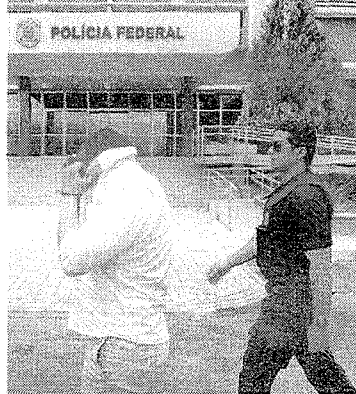
A OPERAÇÃO Cardume foi desencadeada em setembro de 2011 em oito estados