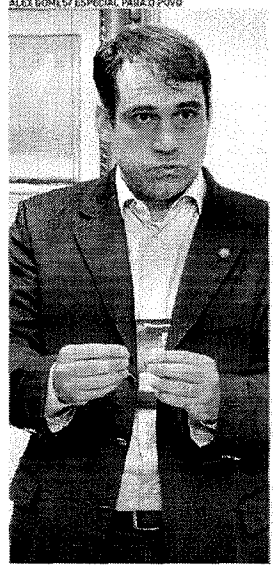
SALMITO defende que projeto apresentará soluções para desafios da RMF