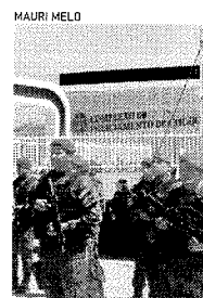
EQUIPAMENTO será utilizado para treinamento de PMs