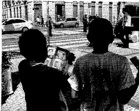
REDUÇÃO DO TRABALHO INFANTIL apontada pelo IBGE seria resultado de mudança na metodologia