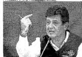
MINISTRO Mandetta: "Quem tem mandato fala e quem não tem trabalha", sobre o chefe Bolsonaro, que tem mandato

As palavras são muito reveladoras. Primeiro, de que o presidente não tem autoridade sobre o ministro. O presidente e o chefe de deve fazer ouvir. Não é concessão do ministro. Segundo, quem deve conduzir o País não é o ministro, é o presidente. Ou deveria ser assim. Terceiro, chefe não dá bronca em subordinado em público. Ou determina que ele faça diferente ou troca. Se não tem como fazer nem uma coisa nem outra, fica quieto. As declarações do presidente demonstram fraqueza.